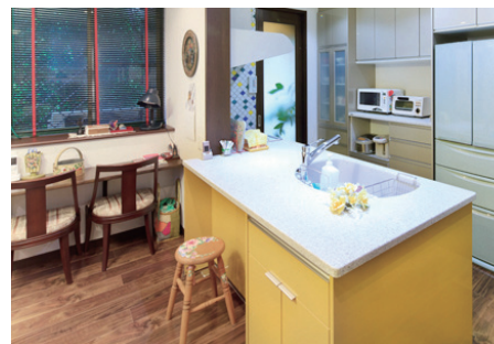
▲ 楽しくお料理したいとのご希望でイエローのキッチンに。コンロ前面・側面にはタイル貼りでインテリア性を高めています。