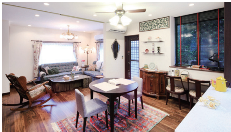
▲ 広いLDK。飾り棚の上にはタイルを貼るなどインテリア性を高めています。

「以前の窓をそのまま使っていますが、部屋の明るさが断然違います。お客様も広さと明るさにびっくりされています。」