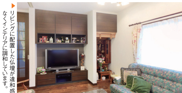
▶ リビングに配置した仏壇が違和感なくインテリアに調和しています。

「亡くなった主人が庭を眺められるようにと、仏壇をリビングに配置してもらいました。みんなが集う部屋で主人も喜んでいるでしょう。」